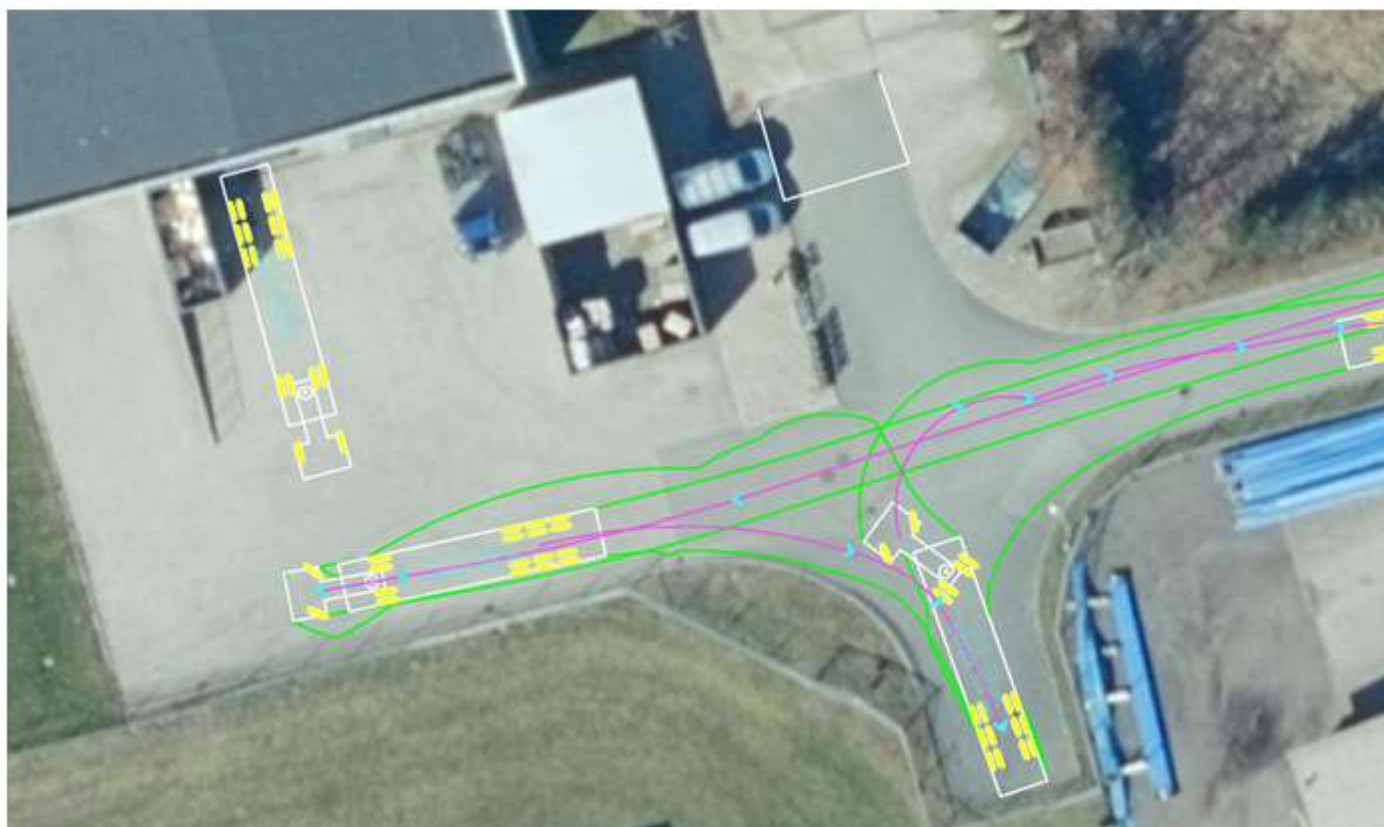
Præciserede kørekurver for sættevognstog.